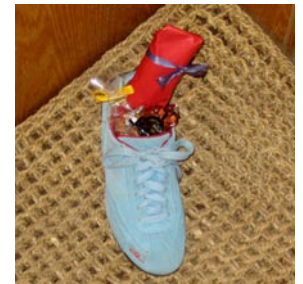
Schuh am Nikolaustag

Am 6. Dezember ist außerdem Nikolaustag. Auch an diesem Tag gibt es kleine Geschenke und Schokolade. Oft auch Nüsse und Mandarinen oder Orangen. Der Nikolaus kommt über Nacht. Daher stellen die Kinder ihren Schuh vom 5. auf den 6. Dezember vor die Tür, so dass er vom Nikolaus befüllt werden kann. Doch nicht immer bringt der Nikolaus Geschenke. Da er die Kinder das ganze Jahr über beobachtet, weiß er über die guten aber auch über die bösen Taten der Kinder Bescheid. Wer nicht brav war, zu dem kommt der Nikolaus nicht mit Geschenken sondern mit der Rute – doch auch das selbstverständlich nur symbolisch!