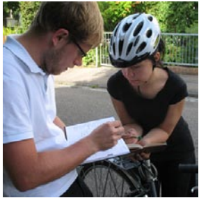
Terminplanung in der Freizeit

Zeit ist ein wichtiges Thema für Deutsche. Sie organisieren ihr berufliches und privates Leben in Terminen und Zeitplänen. Im Beruf, für Treffen in der Freizeit, beim Friseur, beim Arzt, mit der Familie. Alles wird geplant und terminlich festgehalten. Und sie tun alles, um diese Termine und Pläne einzuhalten und erscheinen daher im Umgang mit Zeit äußerst unflexibel. Das hat Vor- und Nachteile: Oft sind zeitliche Absprachen mit Deutschen verlässlich. Allerdings sind spontane Aktionen selten möglich.