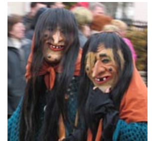
Hexen beim Umzug

Feste, die nicht an Feiertagen stattfinden