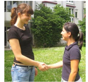
Begrüßung mit Handschlag

In anderen Ländern gehört es standardmäßig zu einer Begrüßung dazu, den anderen zu fragen, wie es im geht. „How are you“, „Como estás“ etc. Jeder fragt das jeden und eigentlich hört diese Frage keiner wirklich. In Deutschland ist es nicht falsch zu fragen: