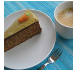
Kaffee und Kuchen

Selbstverständlich hält sich nicht jeder Deutsche an diesen Zeitplan für die Nahrungsaufnahme und oft wird das warme Essen am Mittag auch auf den Abend verschoben oder fällt womöglich ganz aus. Vor allem Studierende sehen den Stundenplan der Mahlzeiten eher flexibel.