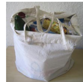
Einkaufstasche aus Stoff

Eine Sache sollte dir in Deutschland in jedem Fall vor dem Einkauf klar sein. Nicht nur was du einkaufst ist wichtig, sondern auch wie viel du einkaufst muss gut kalkuliert werden. Denn in Deutschland ist es nicht üblich Plastiktüten zu bekommen. In vielen Läden erhältst du eine Tüte, wenn du danach fragst, aber die kostet meistens Geld. Daher nehmen die meisten Deutschen bereits eine Stofftasche oder einen Korb mit, wenn sie einkaufen gehen. Grund dafür ist die Umwelt. Die Deutschen leben äußerst umweltbewusst und durch das Einsparen der Plastiktüten, wird die Umwelt geschont.